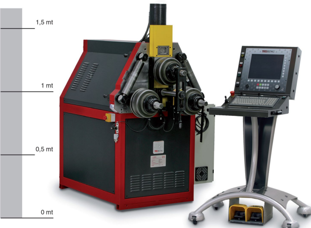
DELTA 60 equipaggiata con CNC-i DELTA 60 equipped with CNC-i