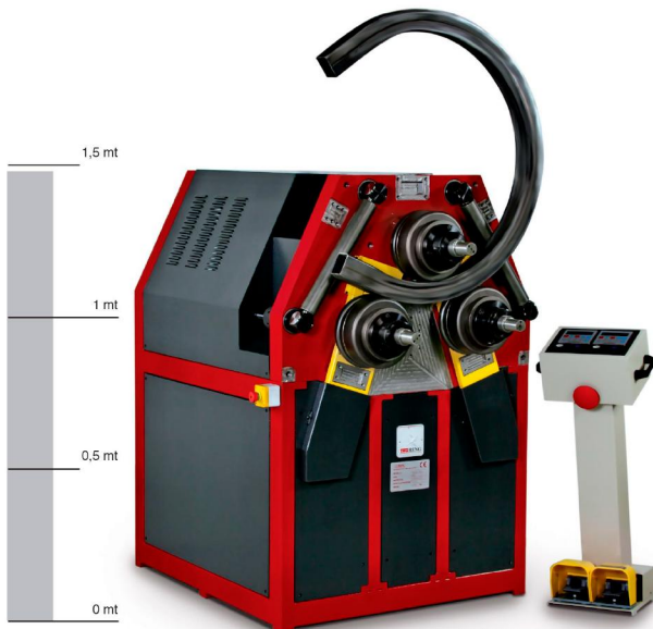
ALPHA 80 equipaggiata con PQI ALPHA 80 equipped with PQI