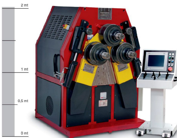
ALPHA 120 equipaggiata con PQ10 ALPHA 120 equipped with PQ10