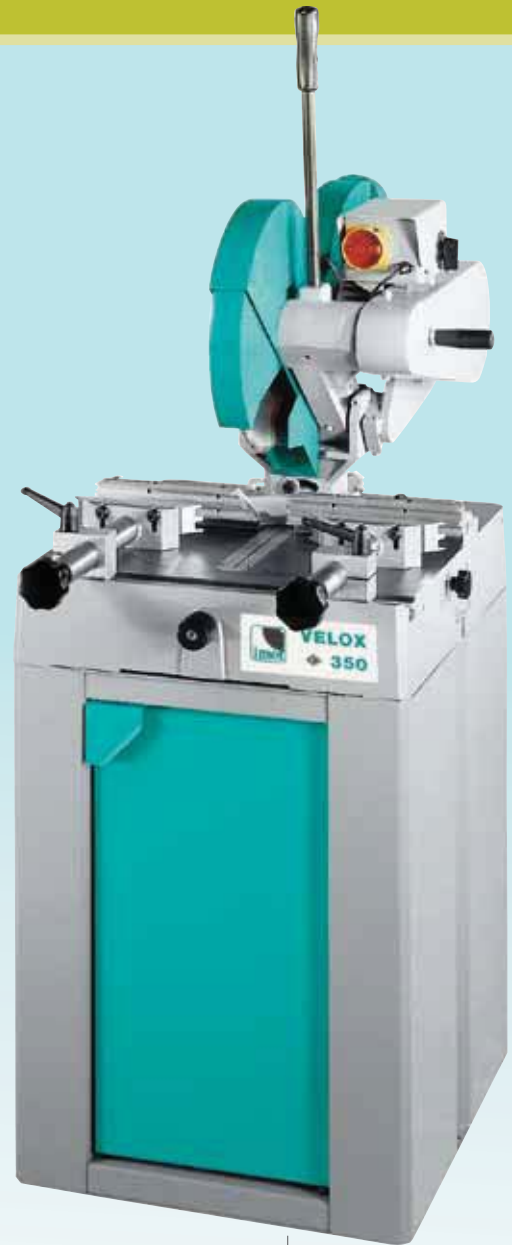
OPTIONAL h 895mm

▶ Arresti automatici a 0°, 15°, 30°, 45° destra/sinistra. Easy stops at 0°, 15°, 30°, 45° left and right. The head bends 45° on the vertical axis to allow inclined cuts.