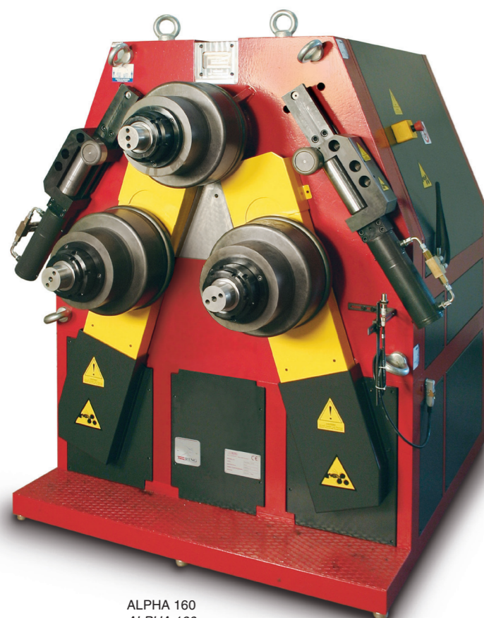
ALPHA 160 ALPHA 160