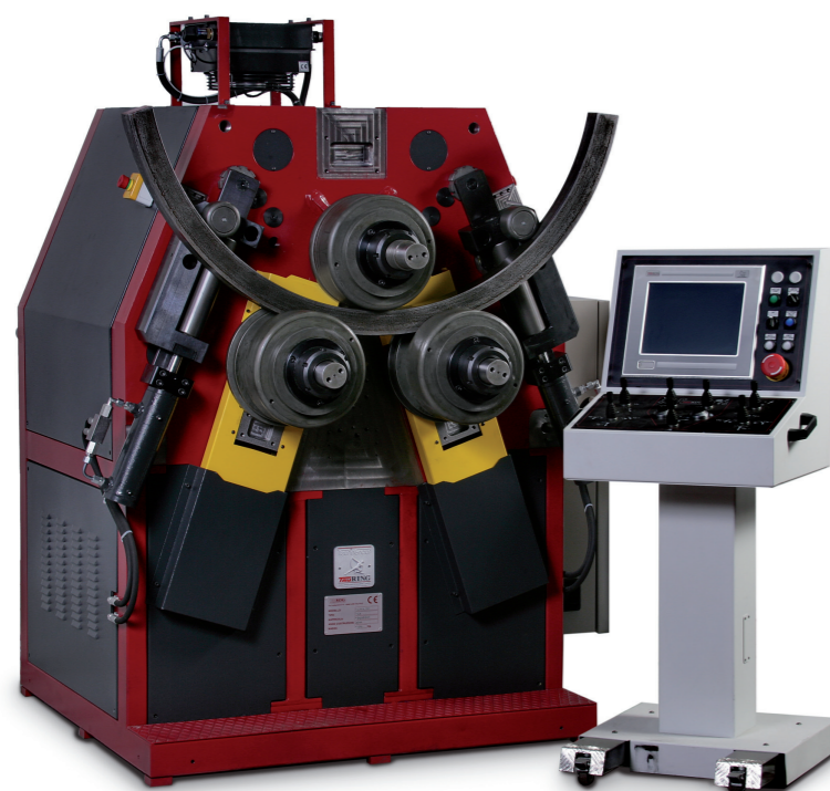
ALPHA 100 equipaggiata con PQ10 ALPHA 100 equipped with PQ10