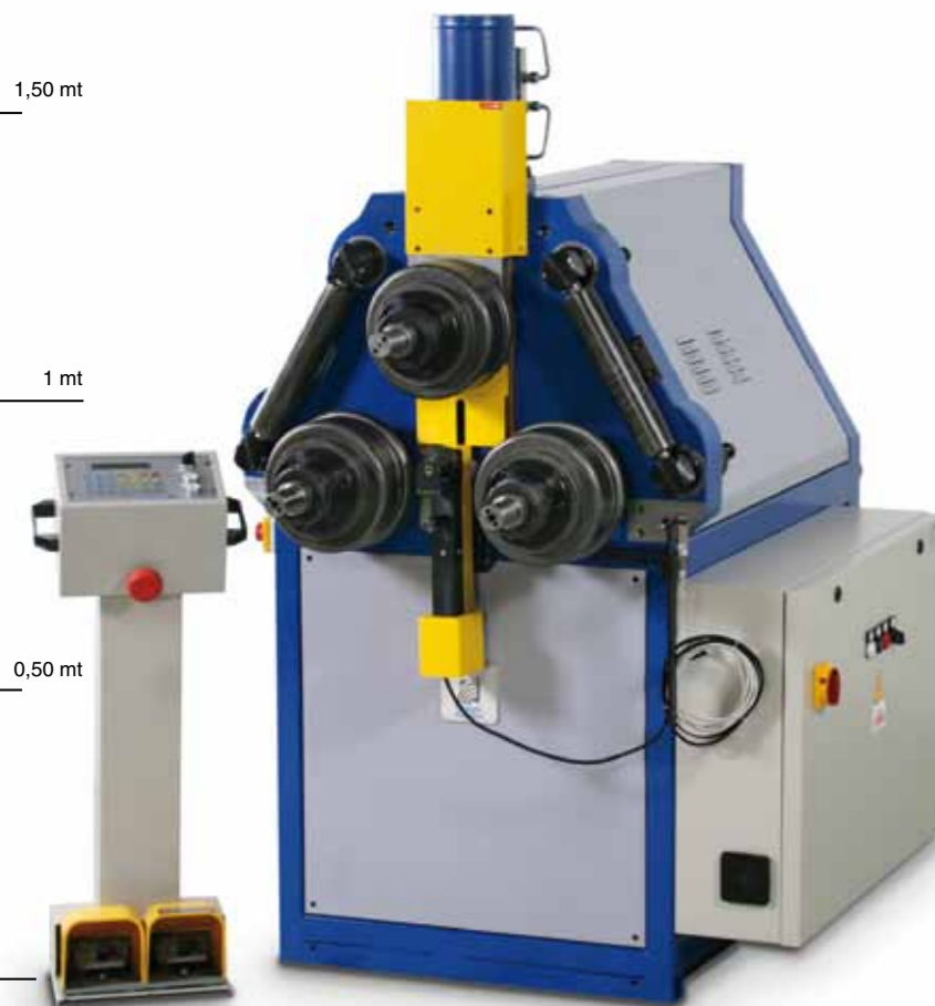
DS 80 equipaggiata con CN DS 80 equipped with CN

Curvatrice a doppio corpo per la suddivisione degli sforzi della catena cinematica con trasmissione moto a giunti cardanici ed innovativa protezione meccanica a frizione. Alberi standard con parte utile maggiorata, rispetto a tutti i pari modelli della concorrenza, per la lavorazione di profilati particolarmente larghi.